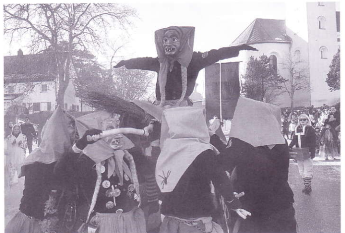
Besenpyramide beim Umzug in Schmalegg.

Am Freitag, 13. Januar, machten wir uns mit dem Bus auf den Weg nach Plochingen zur Abendveranstaltung der Waldhornhexen. Dort führten wir unseren Hexentanz auf, der beim Publikum gut ankam.