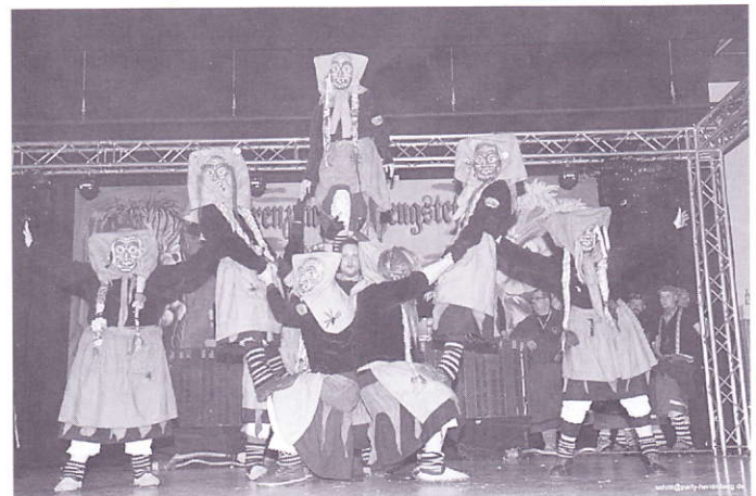
Auftritt in Althengstett.

Am Samstag machten wir uns schon früh mit dem Bus auf den Weg nach Schmalegg. Bei guter Stimmung im Bus kam uns die Fahrt auch gar nicht so lange vor. In Schmalegg wurden wir von bestem Wetter und tollem Publikum erwartet. Nach einem kurzen aber sehr schönen Umzug stärkten wir uns mit einer Kleinigkeit für die Weiterfahrt nach Althengstett. Bei den Glammhoaga Hexa angekommen, führten wir auch gleich unseren Hexentanz vor. Anschließend konnte die Party so richtig beginnen. Nach einem sehr langen aber schönen Tag fuhren wir mit dem Bus wieder Richtung Heimat.