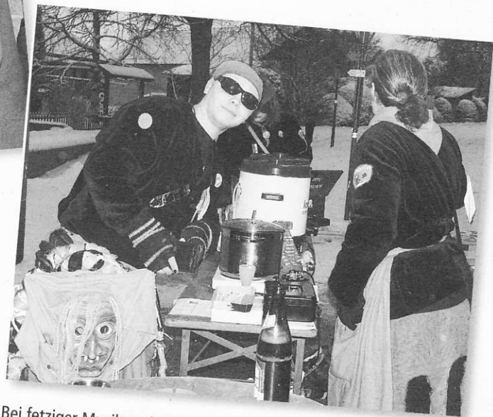
Bei fetziger Musik und eisigen Temperaturen gab es bei den Narren vor der Touristik & Kur heiße Würstchen und kühles Bier.