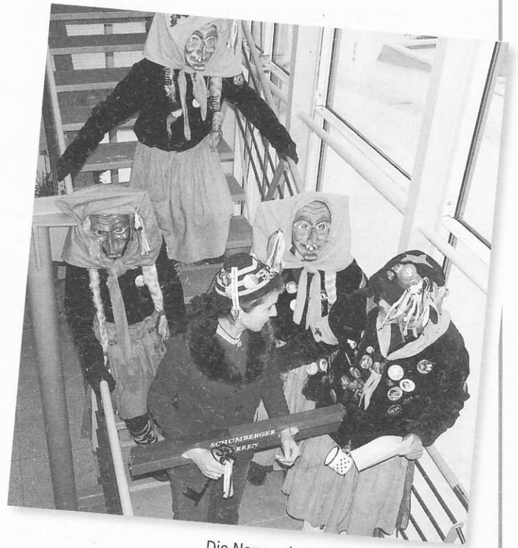
Die Narren demonstrieren ihre Macht.