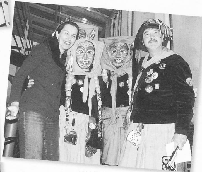
Glückliche Gesichter auf beiden Seiten: Die Narren haben das Regiment übernommen.